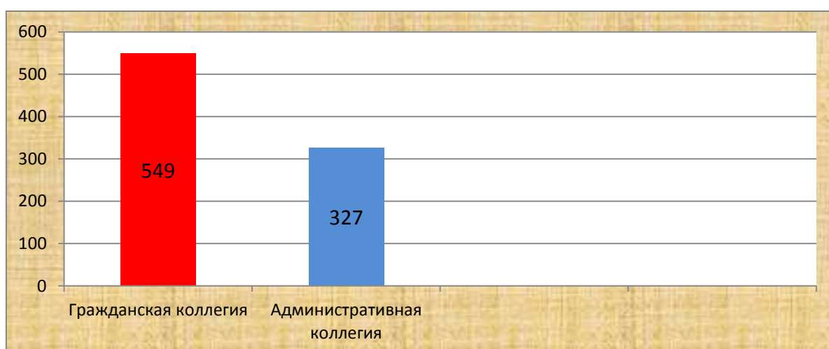
График 1. Соотношение возвращенных апелляционных жалоб между судебными коллегиями Двенадцатого арбитражного апелляционного суда.

Значительное число апелляционных жалоб было возвращено в связи: