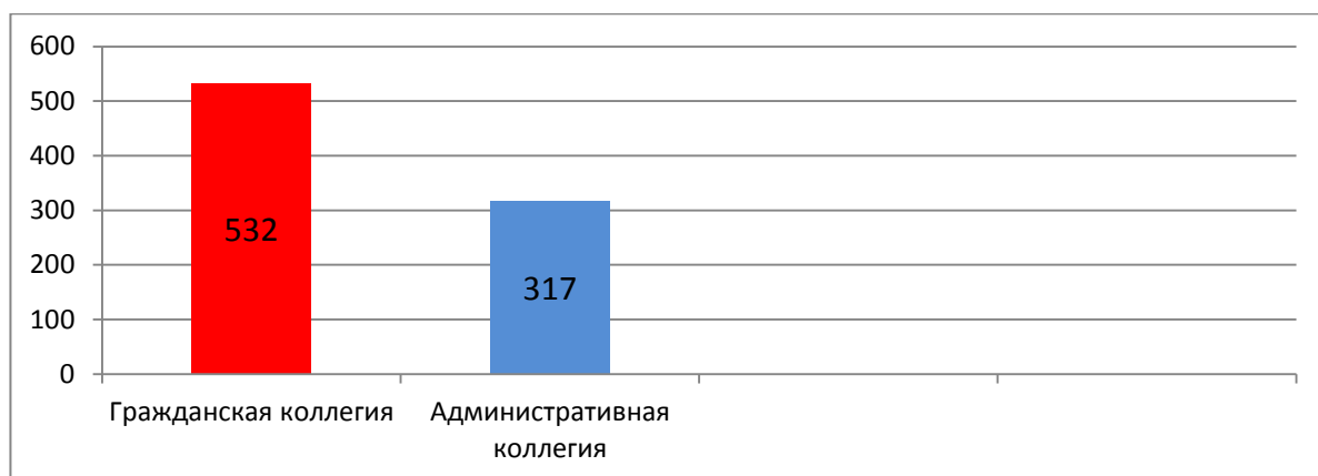
График 1. Соотношение возвращенных апелляционных жалоб между судебными коллегиями Двенадцатого арбитражного апелляционного суда.

Значительное число апелляционных жалоб было возвращено в связи: